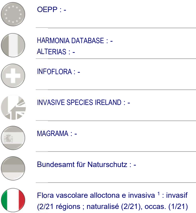
Tab1: Statut de Lindernia dubia dans les pays voisins